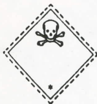
División 6.1 Sustancias venenosas (tóxicas) Grupos de embalaje: I y II Símbolo (Cráneo y huesos en cruz): negro Fondo: blanco