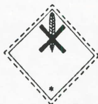
División 6.1 Sustancias venenosas (tóxicas) Grupo de embalaje: III La mitad inferior de la etiqueta debe llevar las inscripciones: DAÑINO - Almacenarse lejos de productos alimenticios Símbolo (La cruz de San Andrés sobre una mazorca de trigo): negro; Fondo: blanco

Las especificaciones de la FAO para los productos para la protección de las plantas, en cuanto al heptacloro (el producto técnico y las formulaciones), indican la composición apropiada y la pureza del heptacloro y recomiendan los métodos para controlar estos valores. El producto técnico debe contener aproximadamente 75% de heptacloro - esto debe ser mencionado en la etiqueta y la composición no deberá desviarse más del 2% de esto.