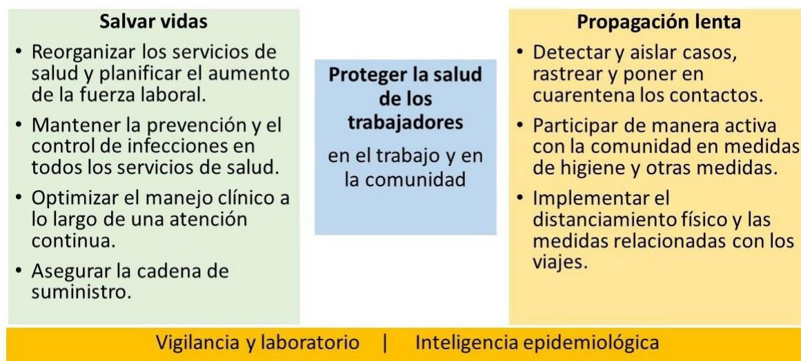
Figura 1. Acciones críticas para responder a la pandemia de COVID-19 en la Región de las Américas