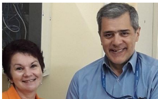
Visita oficial del Representante de OPS/OMS a Infomed