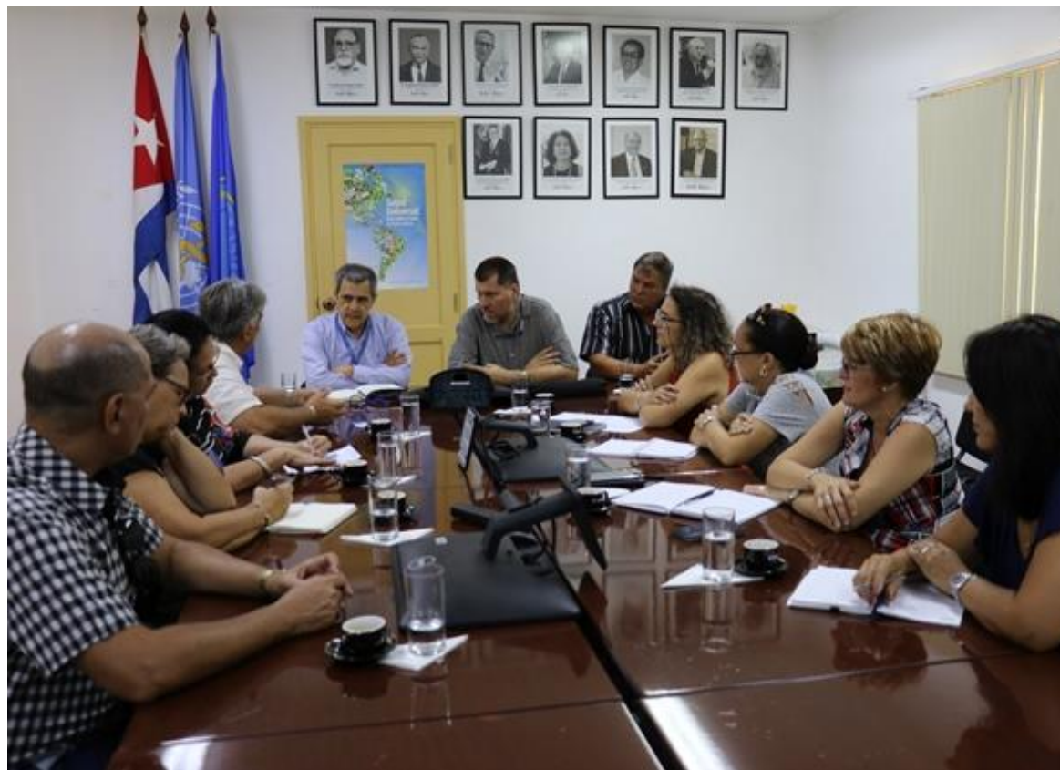
Economía y Salud en la cooperación técnica entre Cuba y la OPS/OMS