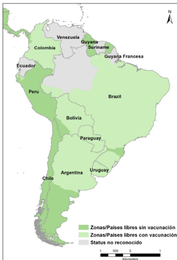
Mapa 1: Situación sanitaria de los países a Abril de 2015 según el reconocimiento de la OIE.