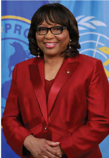
Dra. Carissa F. Etienne Directora Organización Panamericana de la Salud

En el año 2000, a solicitud de los Estados Miembros de la Región de las Américas, se estableció el Fondo Estratégico de la Organización Panamericana de la Salud (OPS), con el fin de mejorar el acceso a los suministros estratégicos de salud pública y contribuir al fortalecimiento y sostenibilidad de los sistemas de salud en la Región.