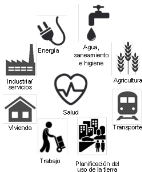
Figura 1. Principales sectores (lista no exhaustiva) relacionados con la salud, el medio ambiente y el cambio climático

ii) Obtener los beneficios sanitarios indirectos derivados de opciones políticas más sostenibles. Es preciso evaluar más ampliamente los perjuicios y beneficios de las medidas normativas, así como sus consecuencias financieras y ambientales. Se podrían obtener beneficios mayores mediante la búsqueda de beneficios sanitarios indirectos y la consideración de la salud desde el inicio de los procesos que definen las políticas.