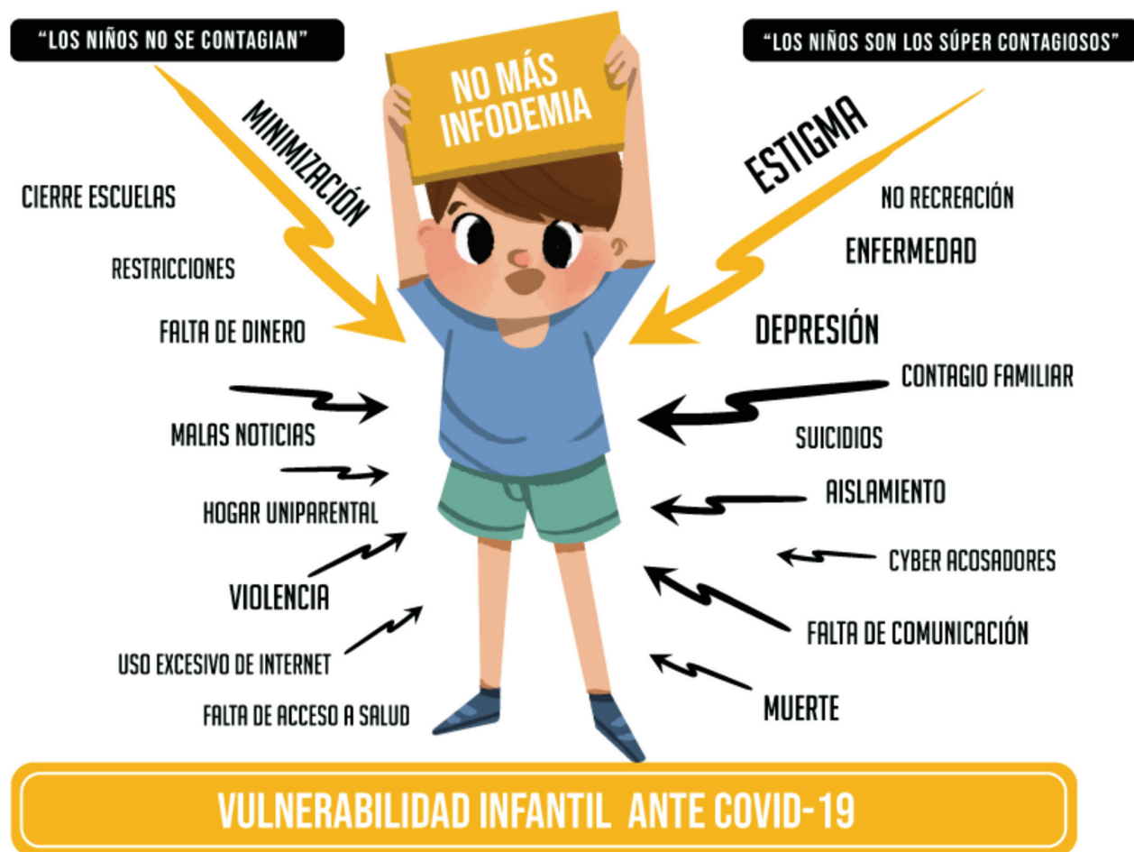
FIGURA 2. Vulnerabilidad Infantil ante COVID-19