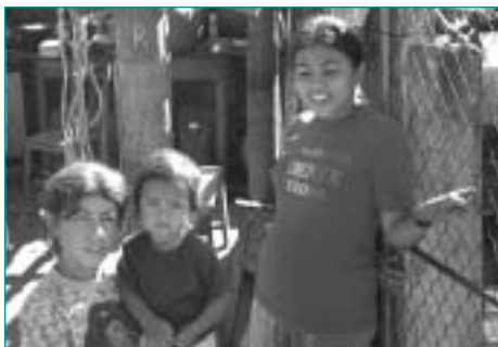
OPS/OMS, J. Jenkins

La meta final de un sistema de gerencia de información en desastres debe ser ayudar a salvar vidas.