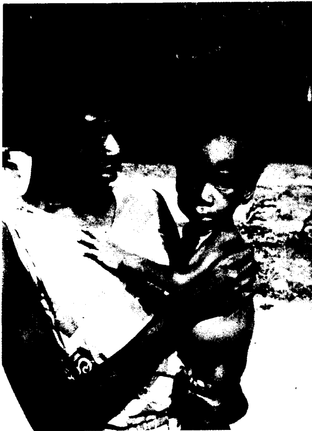
Se ha comprobado que la inmunización de los niños malnutridos con las vacunas del PAI es inocua y eficaz.