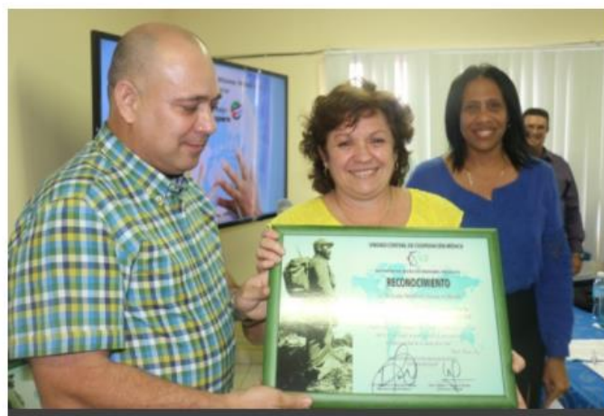
XVII Reunión de Jefes de Misiones Médicas en el Exterior: Cuba aporta a la Salud Universal de más de 60 países