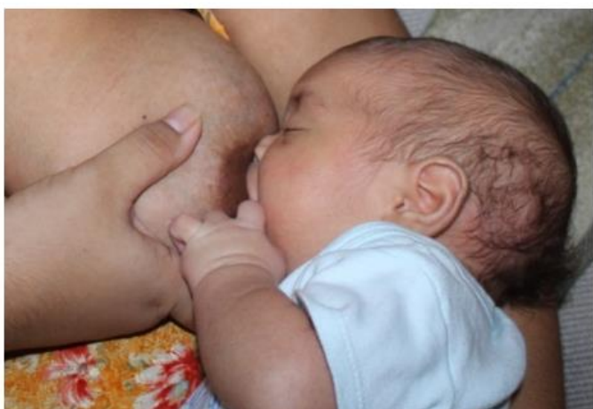
Construyendo alianzas para proteger la lactancia materna en Cuba