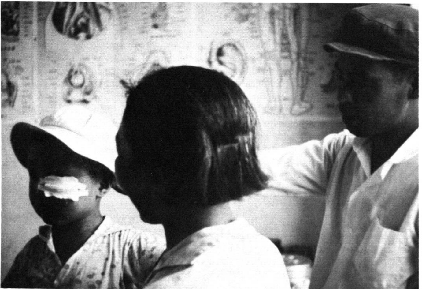
Los consultorios de brigada ofrecen atención primaria y primeros auxilios.

En contraste con algunos países, los individuos que se someten a la vasectomía en China no reciben ninguna recompensa monetaria (6, 7). Con todo, en una sociedad en la que los valores monetarios han sido eliminados de los servicios y las empresas, una de las maneras en que un individuo recibe el reconocimiento y la aprobación social consiste en ser un buen ciudadano y lo que el Gobierno califica de "elemento avanzado" de la sociedad. En términos generales, aparte del deseo de una salud y un bienestar mejores, el patriotismo proporciona a menudo una motivación para las medidas de planificación de la familia. Como incentivo adicional, todo individuo que se somete a