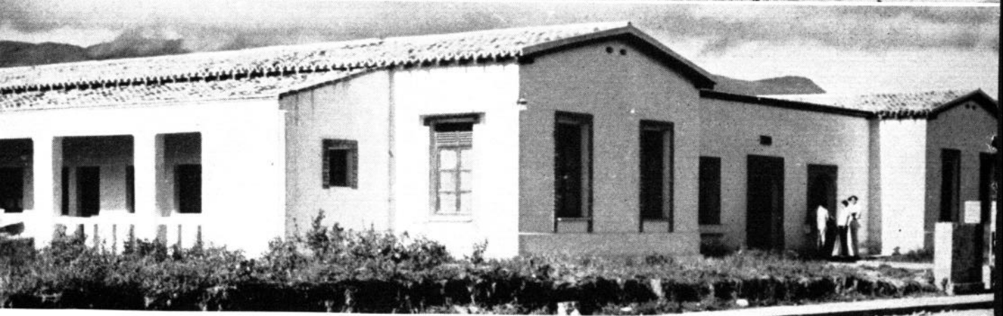
Unidad Sanitaria de Cabimas, Estado Zulia ( arriba ). Unidad Flotante "Dr. J. M. Agosto Méndez"; esta Unidad presta asistencia médica general a grupos de población dispersa en las riberas del río Orinoco, y fué creada en julio de 1949 ( centro ). Unidad Sanitaria de Rubio, Estado Táchira ( abajo ).