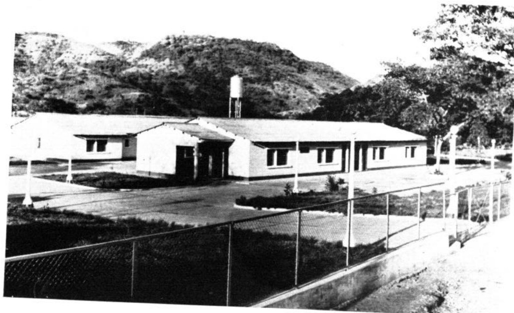
Centro de Salud de San Sebastián, Estado Aragua, con 25 camas y Servicios Preventivos, inaugurado en febrero de 1951.