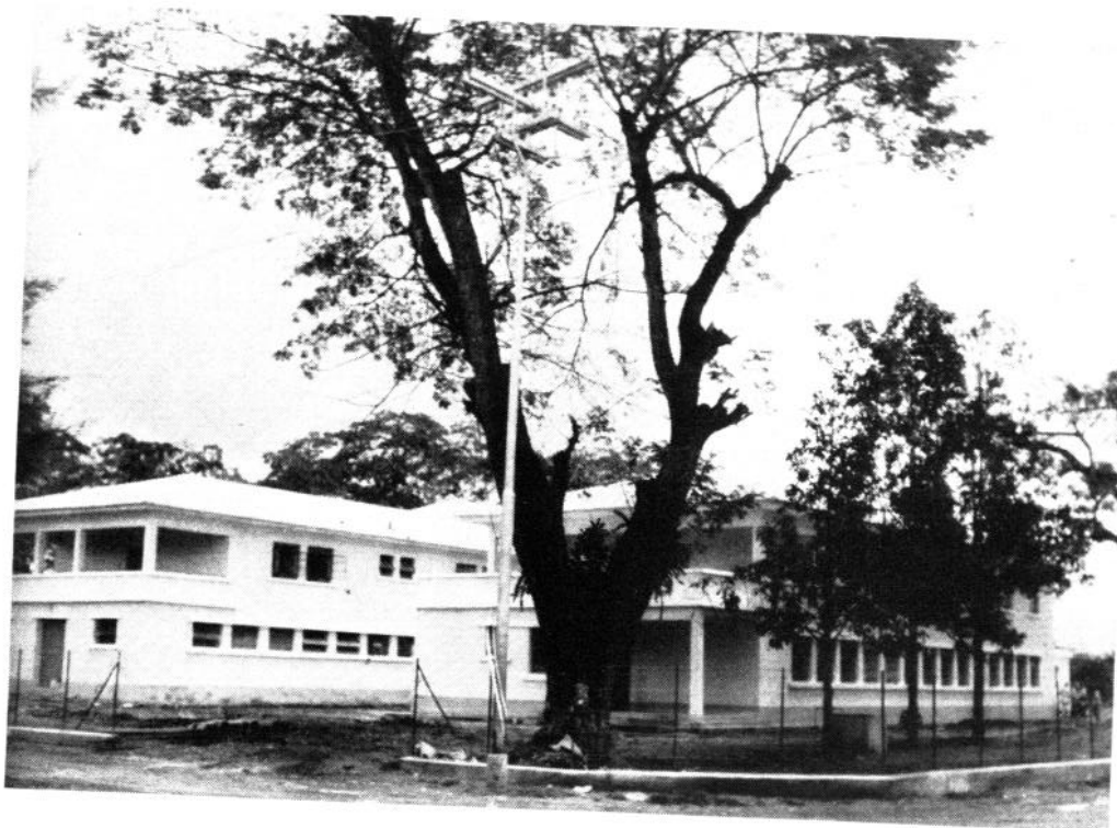
Centro de Salud de Caucagua, Estado Miranda, con 50 camas y Servicios Preventivos.