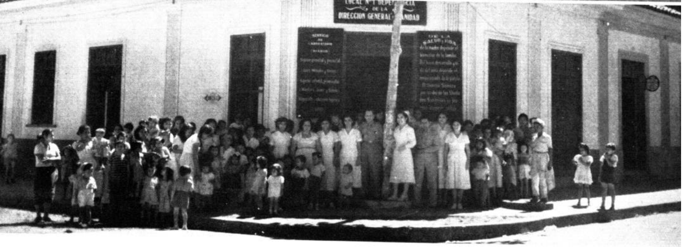
Centro de Salud de León, Departamento de León ( arriba ). Centro de Salud de Granada, Departamento de Granada ( centro ). Centro de Salud "Colonia Gral. Somoza", Managua, Departamento de Managua ( abajo ).