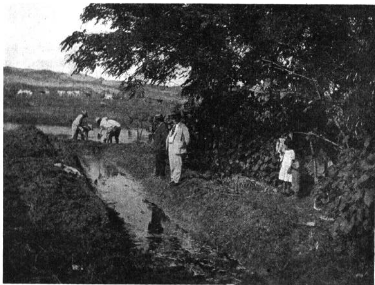
El Jefe del Servicio y Jefe del 20. Distrito, presenciando la apertura de una Zanja en la Avenida Cuauhtemoc y J. B. Lobo. Servicio Antilarvario, Veracruz, 1924

Para terminar haremos constar que el Departamento de Salubridad Pública en Veracruz ha creído prudente visitar continuamente las embarcaciones y el puerto, así como el Castillo de San Juan de Ulúa, con el fin de evitar la formación de eriaderos de mosquitos. Con todas estas medidas es de esperarse que tienda a desaparecer el peligro de la fiebre amarilla en la costa del Golfo de la República de México.