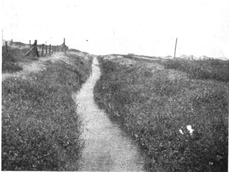
Zanja abierta en "5 de Mayo" Norte, por la Brigada de Zanjeros del Servicio Antilarvario, Veracruz, 1924