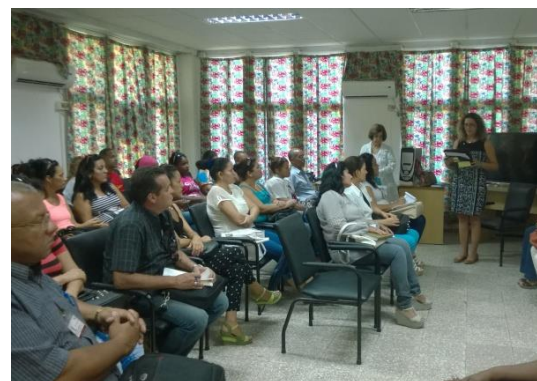
Se inaugura una nueva sede de la Maestría de Economía de la Salud en la provincia de Cienfuegos