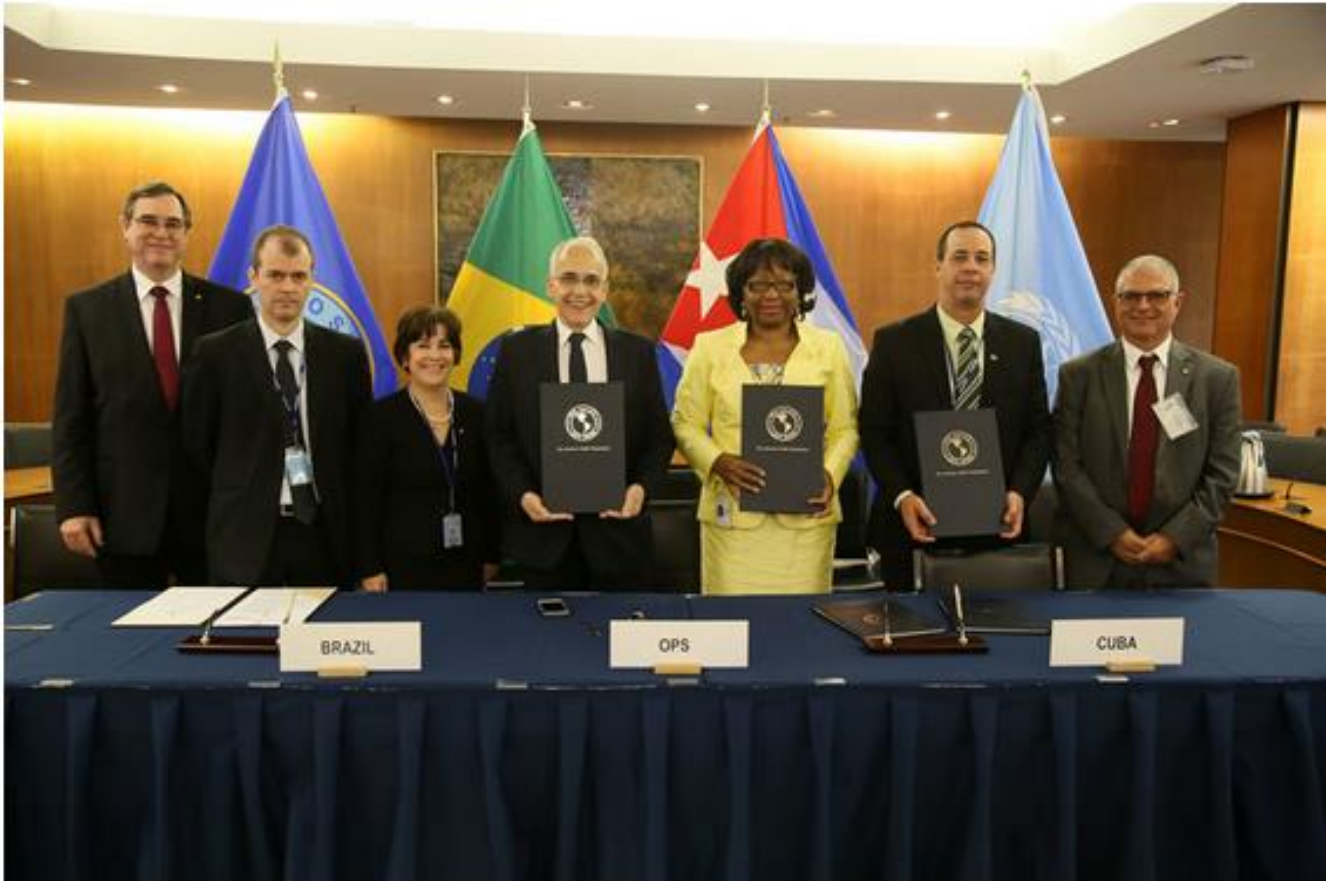
La OPS/OMS y los gobiernos de Brasil y de Cuba oficializan en Washington la renovación del Programa Mais Médicos