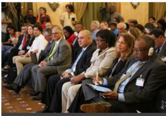
Sesiona en La Habana Reunión Regional para la Estrategia de Vigilancia y Control de las Arbovirosis