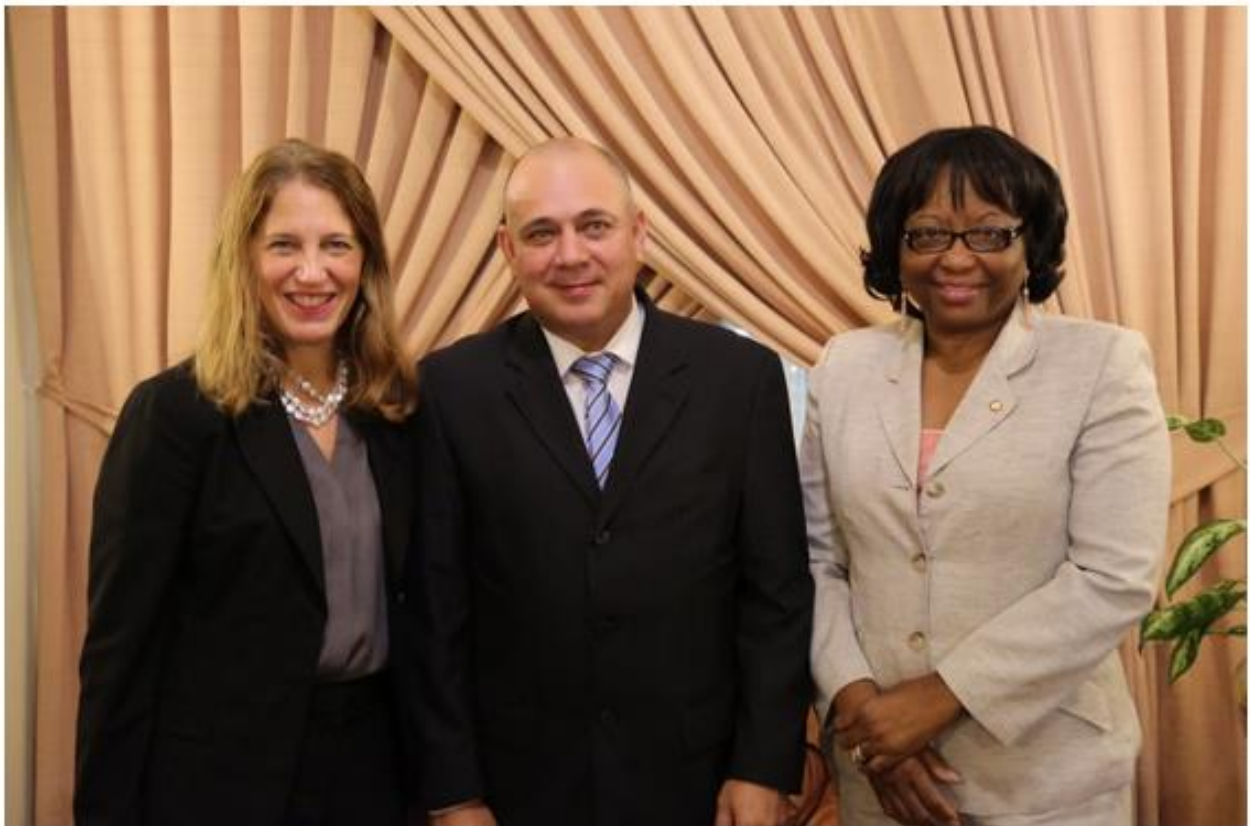
Directora de OPS se reunió con los ministros de Salud de Cuba y Estados Unidos en la Habana