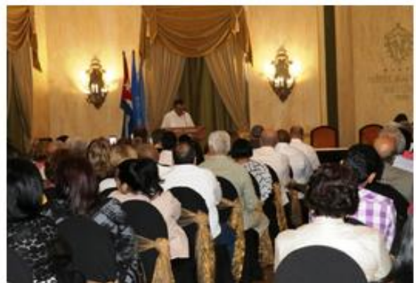
Consenso de La Habana. Reunión Regional para la Estrategia de Vigilancia y Control de las Arbovirosis