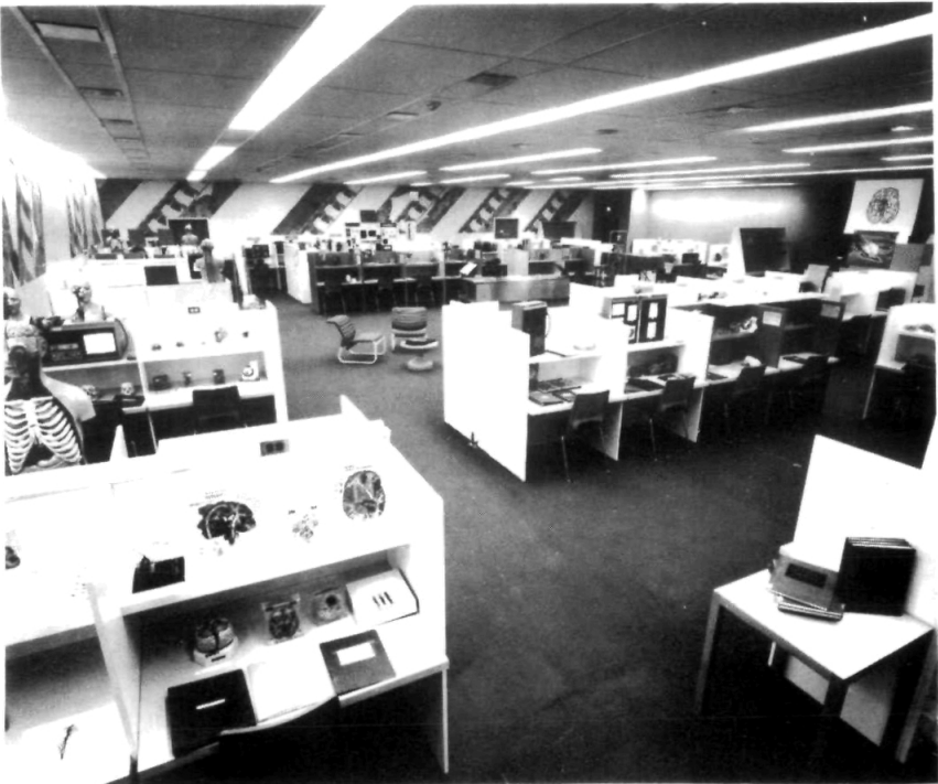
Vista panorámica de una sección del laboratorio de anatomía en el que se observan “módulos” en su lugar.

d) Usando el mismo material que integra un solo módulo, se pueden preparar guiones o cintas magnetofónicas de instrucción a diferentes