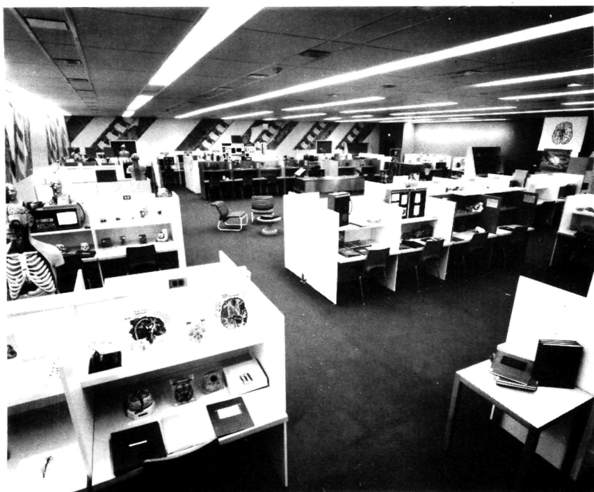
Vista panorámica de una sección del laboratorio de anatomía en el que se observan “módulos” en su lugar.

d) Usando el mismo material que integra un solo módulo, se pueden preparar guiones o cintas magnetofónicas de instrucción a diferentes