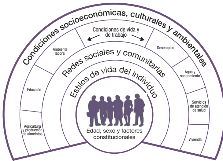
Figura 3. Los principales determinantes de la salud