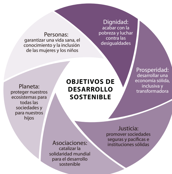
Figura 2. Las seis esferas de importancia crítica para la ejecución de la agenda para el desarrollo sostenible después del 2015