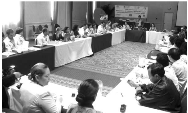
Taller Observatorios de Violencia "Mejores Prácticas". El Salvador 10-12 de Julio, 2007.

Adicional a la socialización de las experiencias y del reconocimiento de abordajes exitosos en el tema de violencia, se logró ajustar la información de las experiencias incluidas en este documento, datos que no fueron posibles de recopilar a través de la encuesta de documentación de experiencias. De la misma forma se retomaron como puntos de discusión los resultados de las plenarias realizadas durante el taller al final de cada uno de los temas, aspectos centrados en metodologías, fuentes y uso de información, vinculación a redes y desafíos.