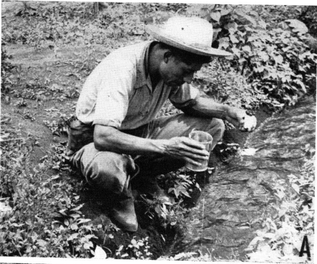
FIG. 2.—(a) Tratamiento larvicida con emulsión de DDT, a razón de 0,1 ppm por 3 minutos. El larvicida se vierte de la lata al arroyuelo por medio de un sifón. Los frascos de concentrado de emulsión que se ha de usar en el tratamiento de las aguas se llevan en un cinturón de lona provisto de bolsas. (b) Se determinan las variaciones de la población de moscas adultas por la proporción de moscas, recogidas a diario en tubos de ensayo, que pican sobre el sujeto pasivo (sentado) expuesto a las picaduras.