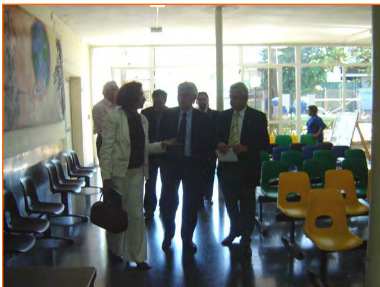
Misión de OPS/OMS visita el policlínico "Vedado"

los cuales estuvo la cooperación internacional de Cuba en el campo de la salud y la estrategia de salud cubana hasta el 2015.